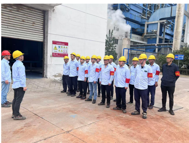
9 月 21 日运行乙值开展盐酸泄漏演练