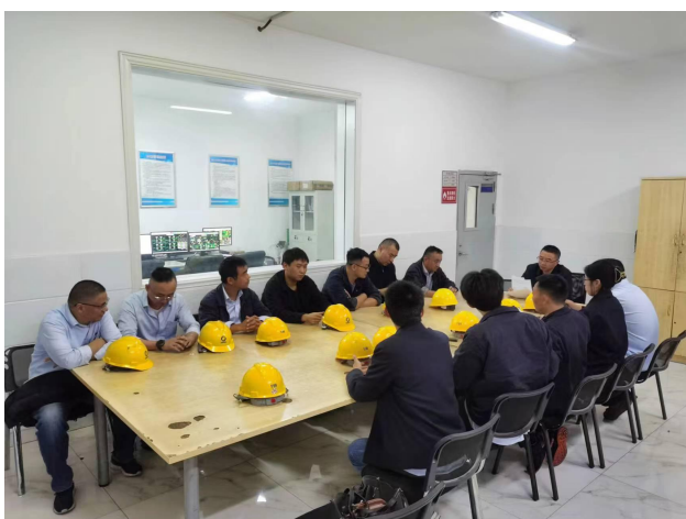
9 月 16 号运行丁值组织开展值际教育培训会议