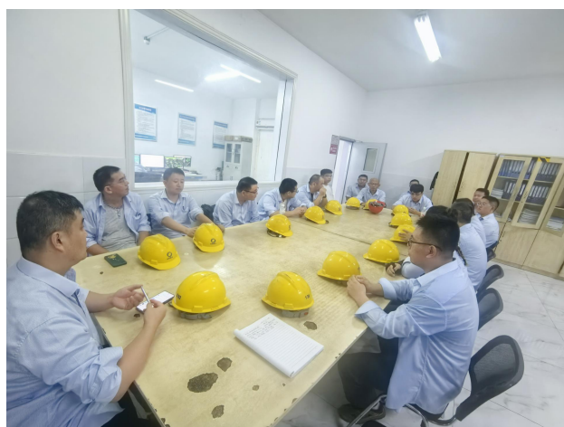
运行丙值开展安全教育分析会